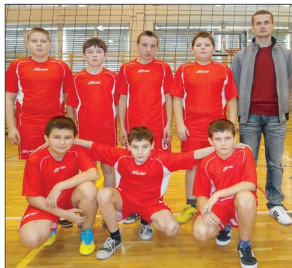
Siatkarska reprezentacja chłopców z SP w Koziebrodach