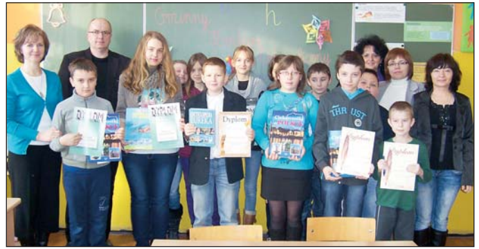
Laureaci i organizatorzy konkursu