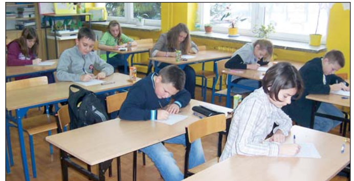
W konkursie uczestniczyli najlepsi poloniści z klas IV-VI