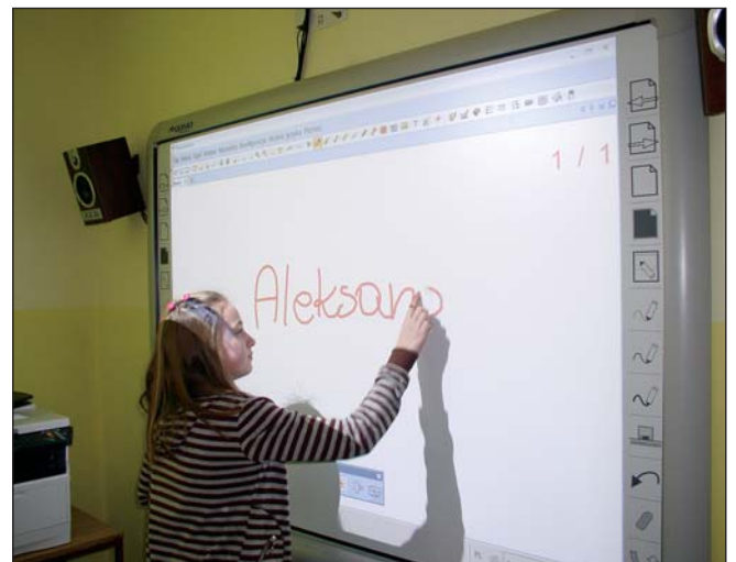
Duże wrażenie zrobiła tablica interaktywna, którą niczym tablet czy telefon dotykowy można obsługiwać palcem

Spotkania, szkolenia i kursy mają ułatwić nauczycielom klas IV-VI realizację wyznaczonych zadań, co