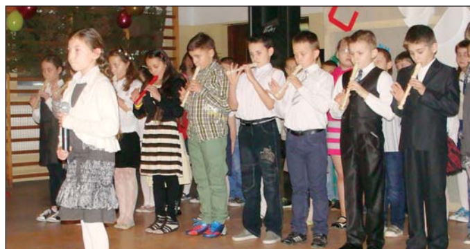
Grupa uczniów zaprezentowała też swoje umiejętności gry na flecie