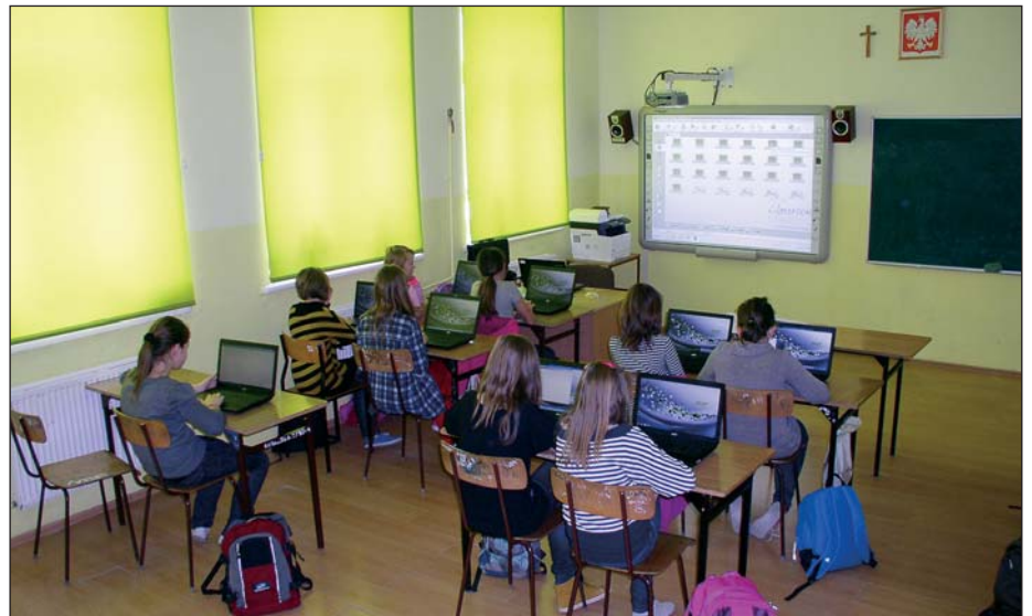
Szkoła w Krajkowie jest jedną z dwóch placówek w powiecie płońskim, które w drodze losowania zostały zakwalifikowane do projektu i otrzymały dofinansowanie na zakup sprzętu

w Warszawie. Poza tym dyrektor i e-koordynator przez cały okres pilotażowy, czyli do 31 maja 2013 uczestniczą w kursie internetowym prowadzonym przez CEO (Centrum Edukacji Obywatelskiej).