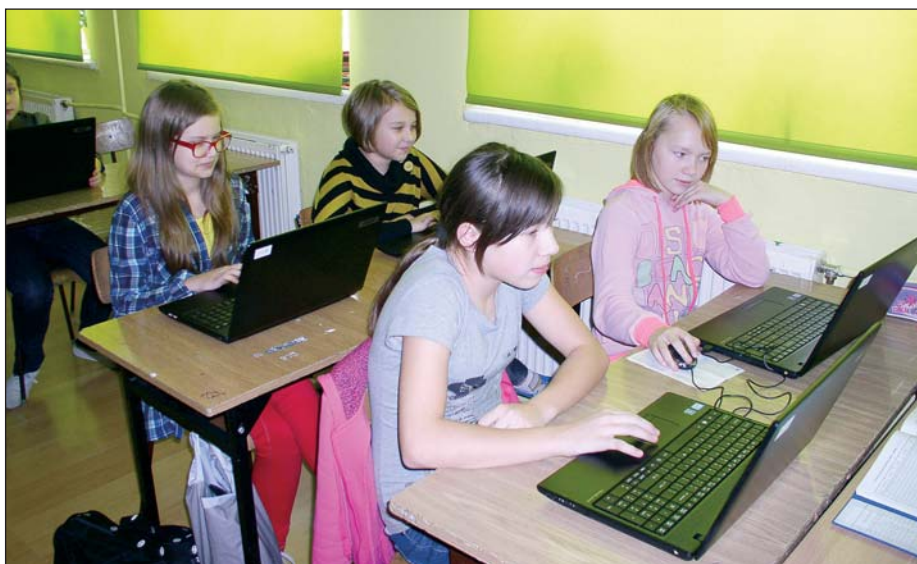
Dzięki temu projektowi placówka wzbogaciła się m. in. o 24 laptopy uczniowskie

dzyszkolnych sieci współpracy co najmniej 3 scenariuszy zajęć lekcyjnych z różnych przedmiotów z wykorzystaniem TIK w nauczaniu lub przykładów dobrych praktyk