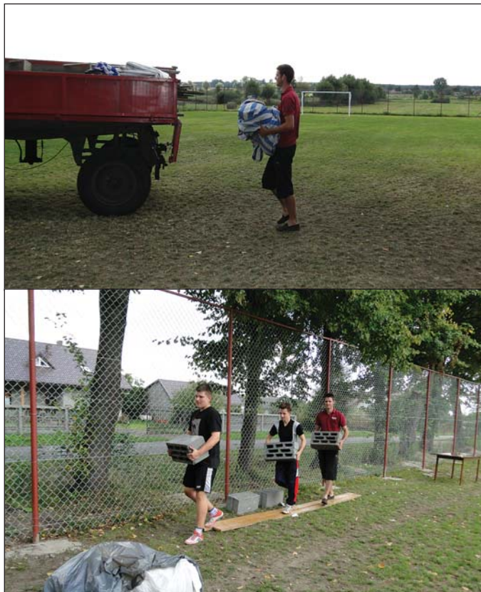
Po imprezie trzeba było posprzątać

Otwarto je w ostatnią niedzielę sierpnia. Było rozrywkowo i sportowo. W ruch poszedł grill. Ale najpierw rozegrano mecz piłkarski: starsi kontra młodzi. Wynik kompromisowy, czyli remis 3:3.