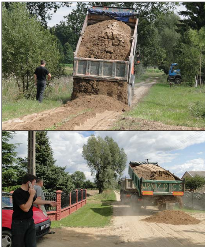
Na zdjęciach dożwirowywanie dróg w Kaczorowach

W tym roku dożwirowaniem objęto drogi w 20 sołectwach gminy Raciąż. W tych, które przeznaczyły na ten cel pieniądze z funduszu sołectkiego. W sumie jest to 87 tys. zł, do których gmina – jak informuje wójt Ryszard Giszczak, dołoży ok. 50 tys. zł.